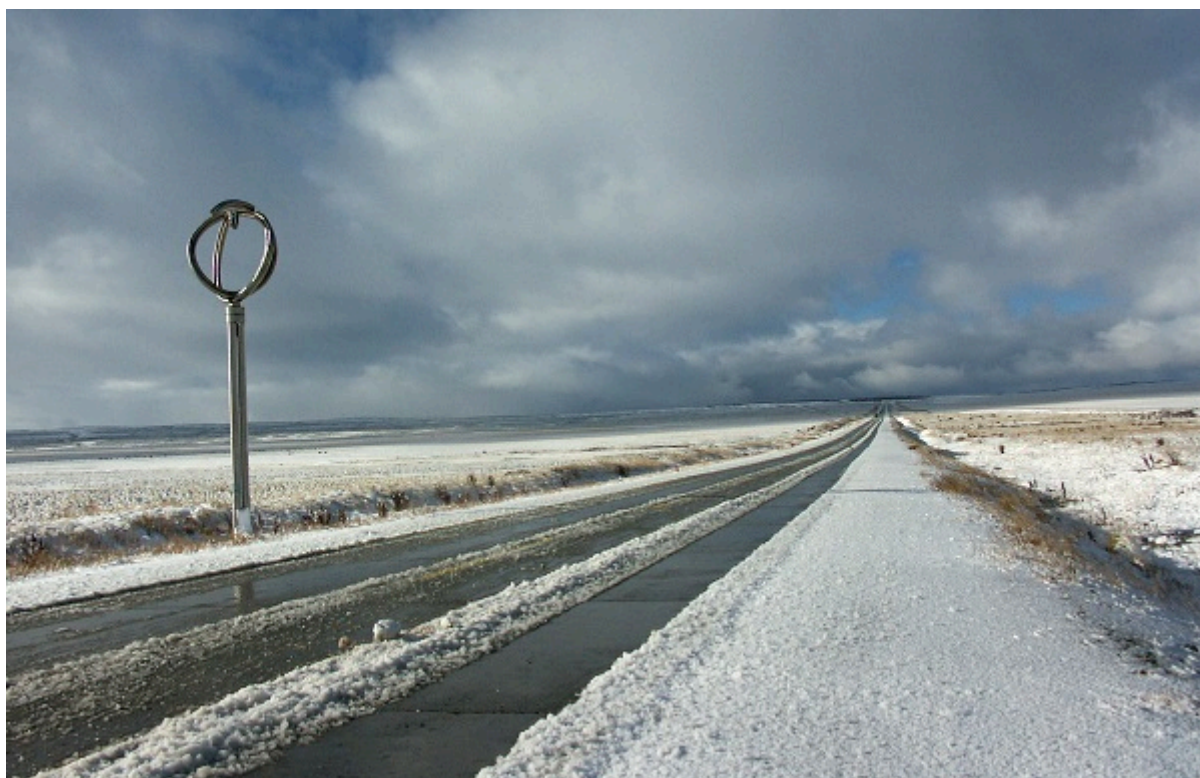
«Homenaje Al Viento»/ Patagonia chilena

Te invitamos a conocer a esta destacada artista nacional, en una entrevista exclusiva para Cultura y Tendencias , en la que -precisamente- destaca que «mi obra no debe ser pesada, tiene que sumarse al paisaje y a la arquitectura».