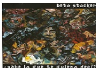
¿Sabe lo que te quiero decir?