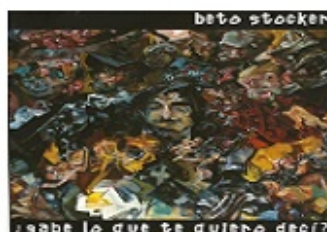
¿Sabe lo que te quiero decir?