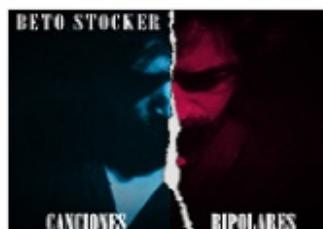
BETO STOCKER CANCIONES BIPOLARES